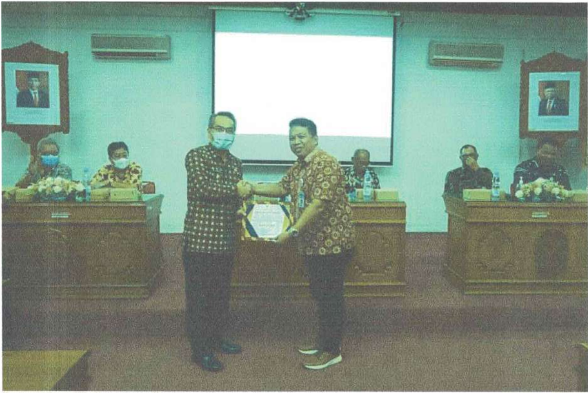
Penyerahan Piagam Kriteria Informatif untuk Dinas Pariwisata