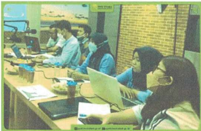
Pendampingan Pengisian SAQ oleh PPID Utama bulan Juni 2022