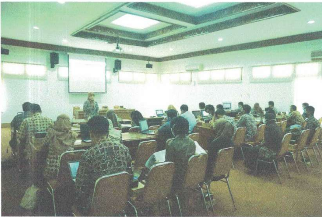
Pendampingan Pengisian SAQ bulan Juni 2022