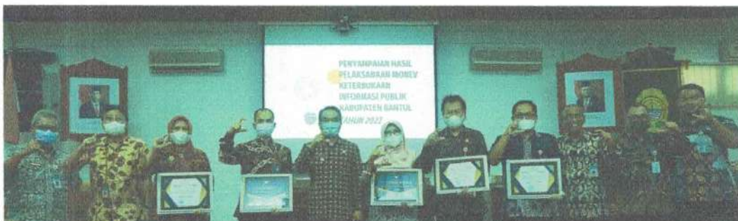
Penyerahan Piagam Penghargaan bulan Oktober 2022